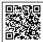
■感染症対策ガイドライン