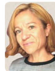
[女子選手] セヴリーヌ・ボルドー