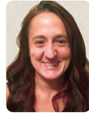
[女子選手] イングリッド・ モレンコフ