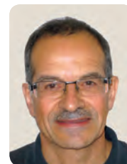
[男子選手] ディディエ・モロー