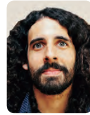
[男子選手] ジェイソン・ トレヴィーノ