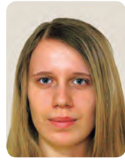
[女子選手] ユリア・ タラセヴィチ