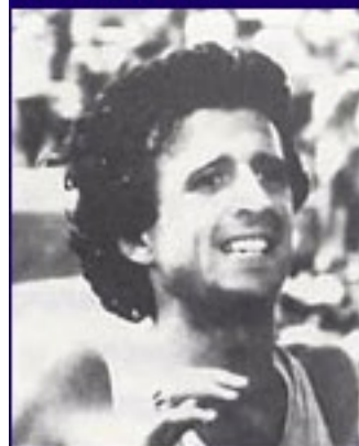
フランク・ショーター Frank Shoorter