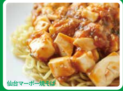
仙台マーボー焼そば

大会会場隣の駐車場では「牛たん焼き」、「ずんだ餅」、「仙台マーボー焼そば」など、仙台名物の屋台が並びます。また、同会場ではオフィシャルスポーツブースや仙台すずめ踊りなどのステージイベントもあり、ランナーの皆様を「おもてなし」いたします。食べて、観て、杜の都仙台を満喫してください。